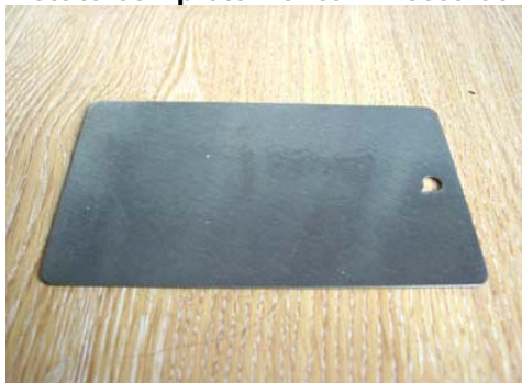
Foto 2: stato della vernice campione permanente alla fine del test.

Anti Graffiti Centar d.o.o. www.antigrafiticentar.hr info@antigrafiticentar.hr